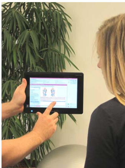
Abbildung 1: Tablet-PC im Einsatz

Weitere Informationen zu azh Befundung finden sich auf www.azh-Befundung.de .